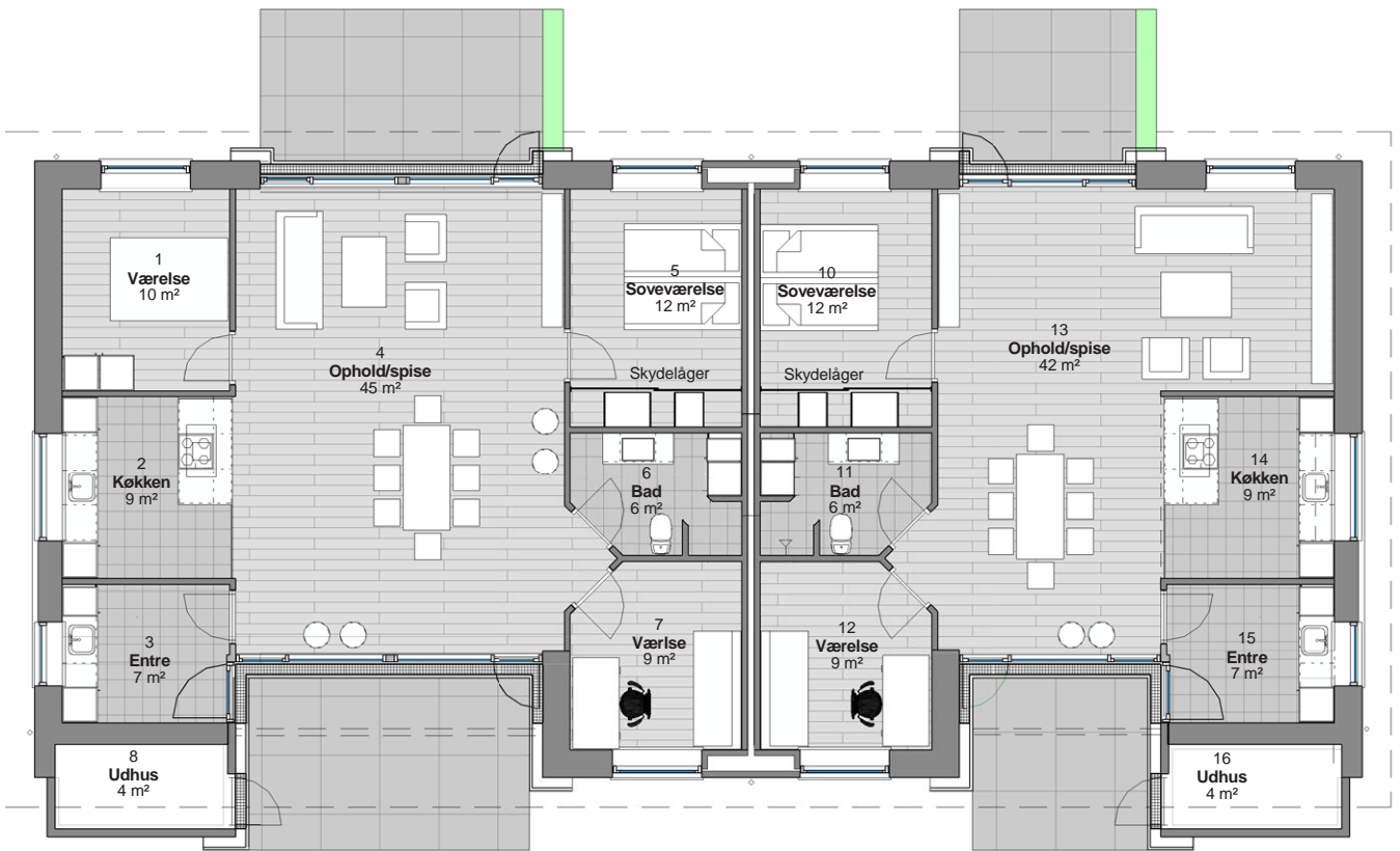
SKOV P ARKEN i måleforholdet 1:133