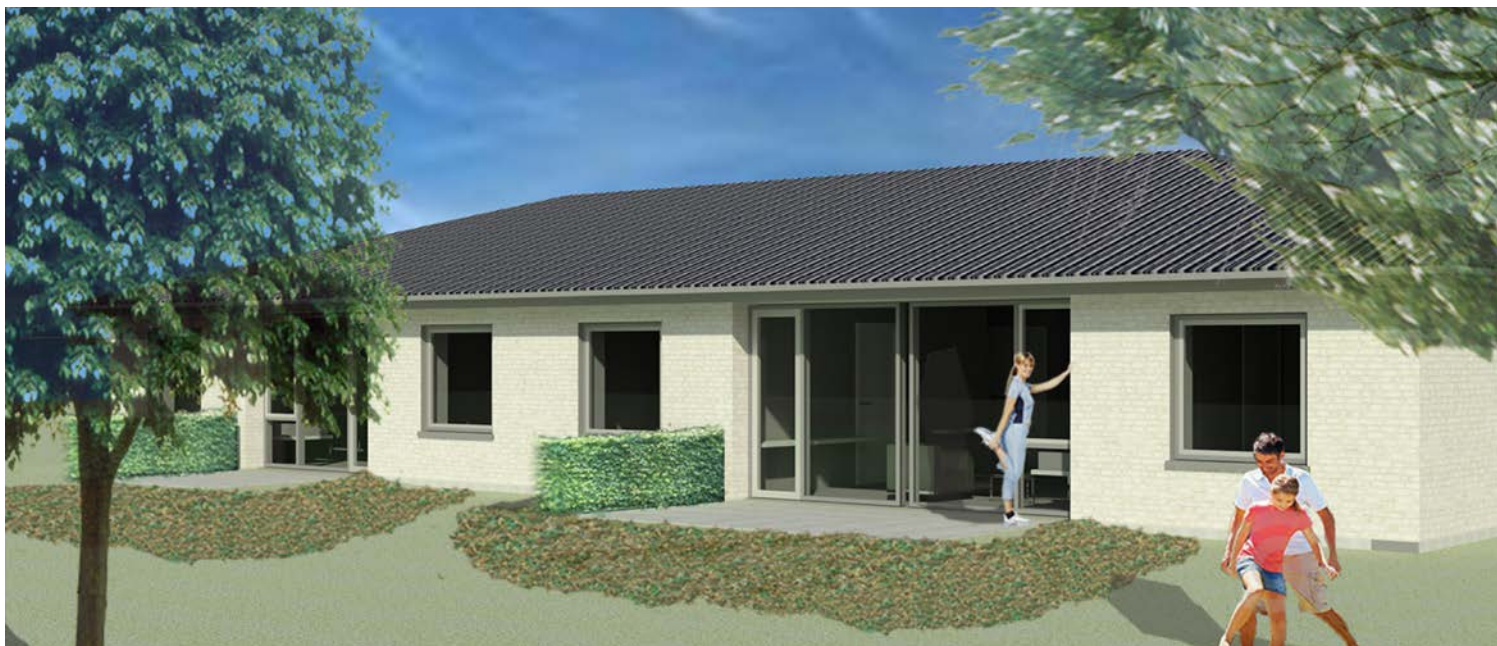
TERRASSEN TIL BOLIGEN